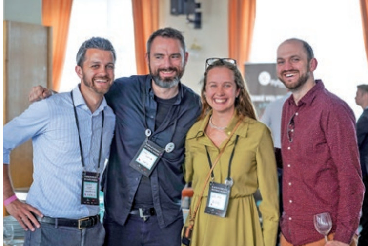
KARLOVARSKÝ BYZNYS MIXER 2022

Někteří oslaví letos již 30 let a předávají podniky nové generaci. Takové podnikání se kromě neustálé dřiny také neobejde bez inovací a růstu a proto bych rád pozval všechny, kteří podnikají, nebo se chystají své podnikání zahájit, na 2. Karlovarský BYZNYS MIXER. Již 15. června 2023 od 9 hodin se v Karlových Varech uskuteční největší konference o podnikání, start-upech a inovacích. Během různorodého programu vystoupí mnoho výrazných osobností, mimo jiné například úspěšná europoslankyně Martina Dlabajová s poutavou přednáškou na