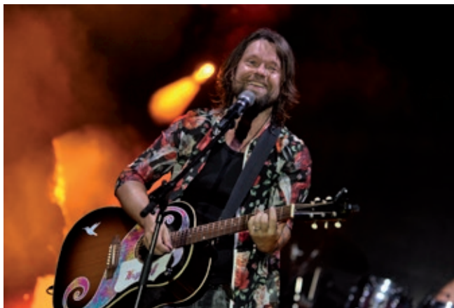
KRYŠTOF, foto z koncertu

Celebrity management s.r.o., producent Janis Sidovský, ve spolupráci s Domem kultury Ostrov. Předprodej: divadlokarlstejn.cz