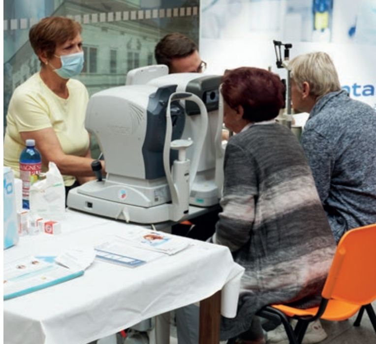
Dvorana ostrovského zámku byla po celé odpoledne plná lidí