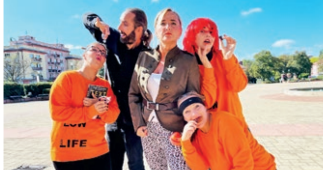
Obsazení z hry Nízkočtučný život