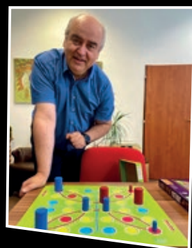
Str. 16 Autor deskovek propaguje Krušnohoří