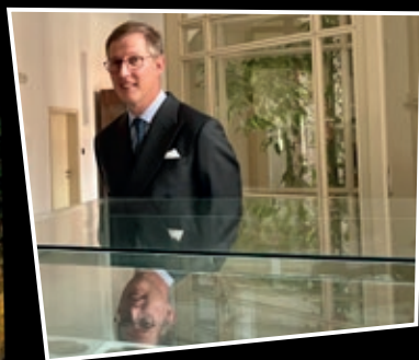
Str. 8 Jeho královská Výsost poprvé v Ostrově

www.ostrov.cz ■ www.ostrovskymesicnik.cz