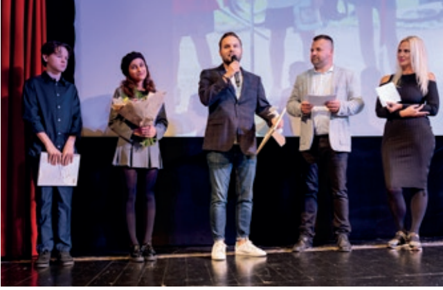
Delegace k oceněnému filmu Děti Nagana