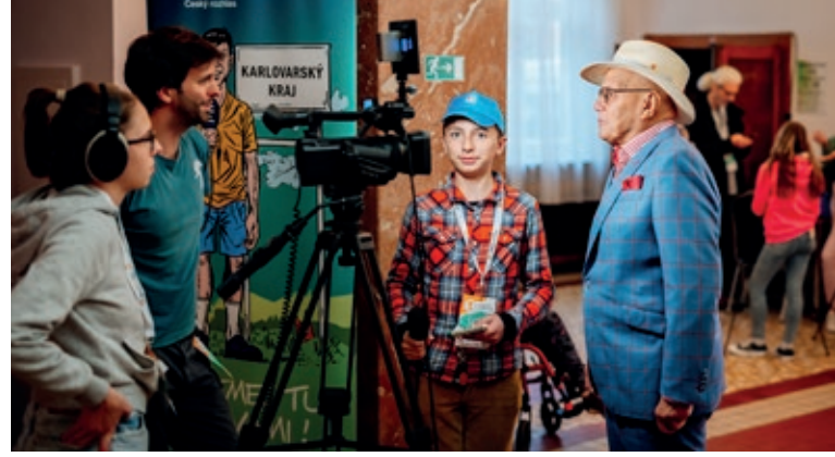
Dětská média při práci, foto: Petr Malcát