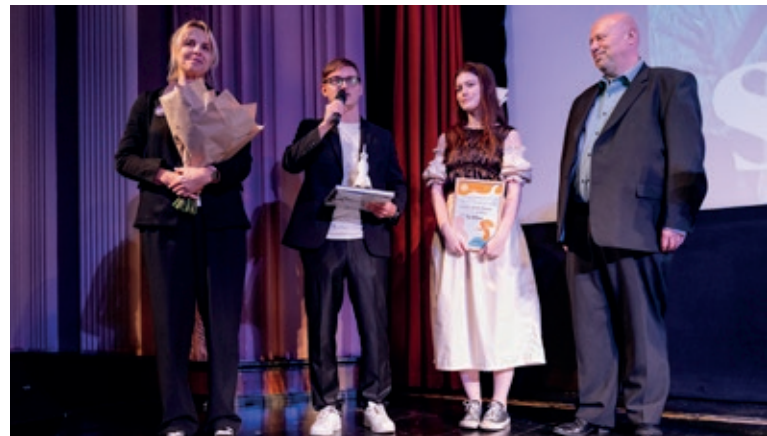
Delegace k oceněnému seriálu Sex O'Clock, foto: Petr Malcát