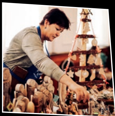
Str. 13 Pro vánoční ozdoby do domu kultury